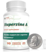
Huperzine A 90 Capsulas solo venta por pedido (20 días para la entrega)

Pure Nootropicos | NOOPH24012023 $170,000