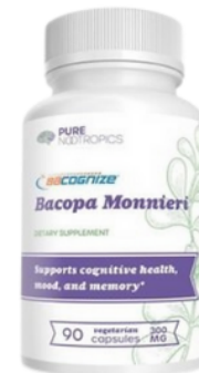
Bacopa Monnieri 90 Cápsulas "Brahmi" - (entrega inmediata)