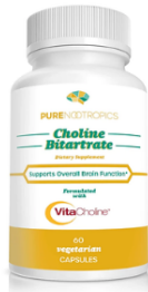
Suplemento Cognitivo Colina complejo vitamínico en Cápsulas ( 20 días para la entrega)