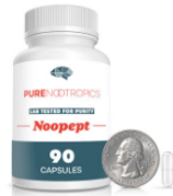
Nootropico - Noopept 90 capsulas de 30 mg (270 dosis)