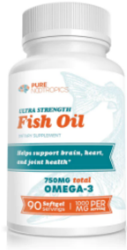
Fish Oil 90 capsulas blandas (20 dias para la entrega)