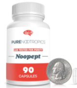
Nootropico - Noopept 90 capsulas de 20 mg