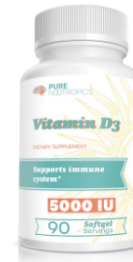
Vitamin D3 5000 IU 90 capsulas blandas ( 20 días para la entrega)

Pure Nootropicos | NOOPAGPC2401202 ... $220,000